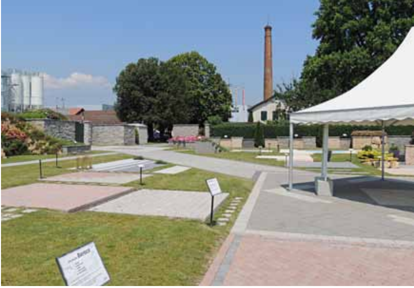
Figure: BFT International

A show garden exhibiting various Cornaz products was installed directly on the Allaman production site