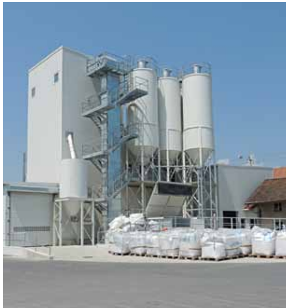
Figure: BFT International

All rotating parts, such as stirring and mixing arms and screw, are inside the mixer, thus effecting the high mixing action. This system eliminates large rotating parts such as a mixer trough. Limit switch and special closing mechanism are situated on the mixer cover, which comes with the usual accessories and an especially fixed unit for adding various additives. As these mixer parts can be replaced outside the actual mixing unit, safety is ensured