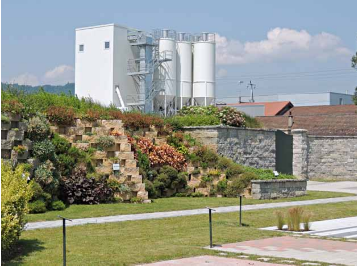
Figure: BFT International

Quite recently, new plant equipment was installed under the leadership of Concrete Machinery Eysink GmbH